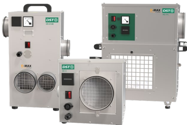
Déshumidificateurs en acier inoxydable de DST. De gauche à droite DR-010B, DC-5, AQ-31L